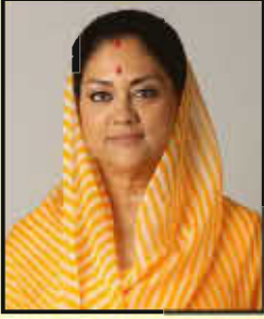
वसुन्धरा राजे मुख्यमंत्री, राजस्थान