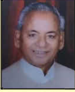
कल्याण सिंह राज्यपाल, राजस्थान राजभवन, जयपुर